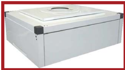
Parte superiore completo di pannello magnetico flottante e cappetta di chiusura