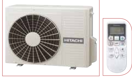
RAC 18~25~35~50 WEB